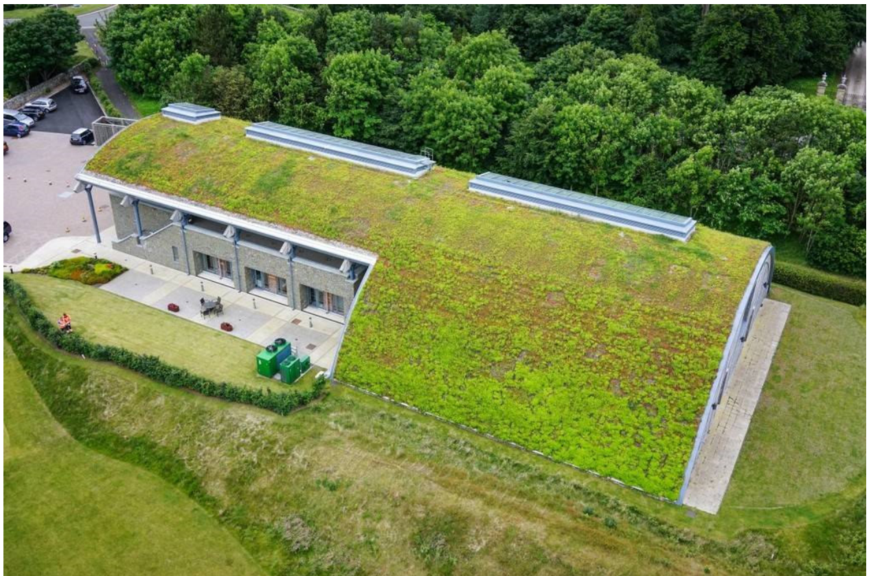
Gestaltungsvorschlag 2 - Dachbegrünung