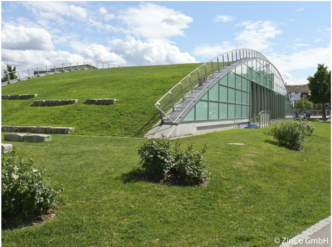
Gestaltungsvorschlag 1 – Integration in vorhandenes Gelände