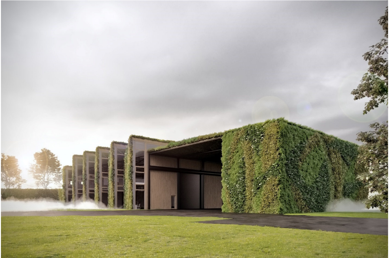
Gestaltungsvorschlag 3 - Wandbegrünung