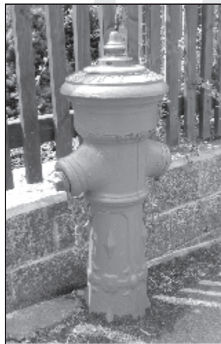
Alter Hydrant, Hauptstraße 120

Nun konnte dieser Hydrant, der durch die Firma A. Helbig aus Chemnitz um die Jahre 1900 bis 1925 errichtet wurde, mit Genehmigung durch den RZV vom Feuerwehrverein Adorf erhalten werden.