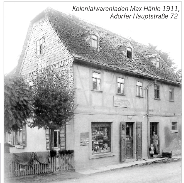
Kolonialwarenladen Max Hähle 1911, Adorfer Hauptstraße 72