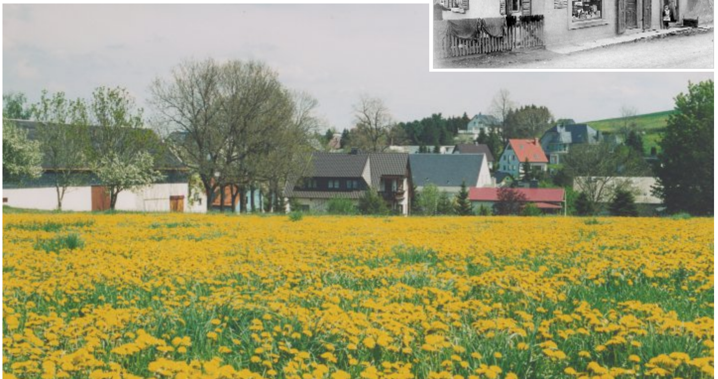
Adorf an der Jahnsdorfer Straße, Hintenweg mit Görner Gut