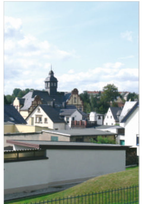
Blick vom „Hintenweg“ auf das Rathaus Neukirchen

Verein für Orts- und Heimatgeschichte Adorf/E. e.V. i. A. Seifert