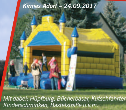
Mit dabei: Hüpfburg, Bücherbasar, Kutschfahrten, Kinderschminken, Bastelstraße u. v. m.