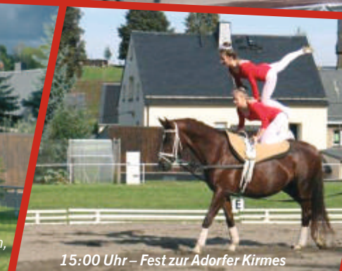
15:00 Uhr – Fest zur Adorfer Kirmes

Dieses Jahr findet turnusmäßig kein Reitfest statt. Erst 2018 wird wieder ein Reitfest mit Schauprogramm veranstaltet.