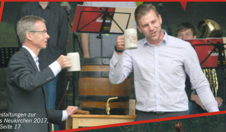
Veranstaltungen zur Kirmes Neukirchen 2017, siehe Seite 17