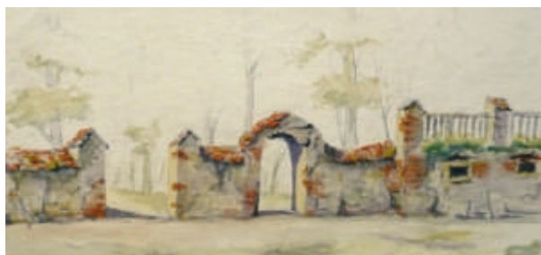
Mauerreste am Rittergut